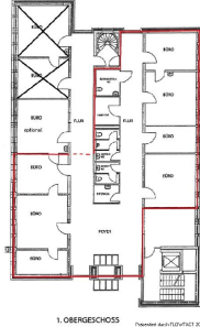
1. OBERGESCHOSS Planmetr nach FLURPLATZ 207